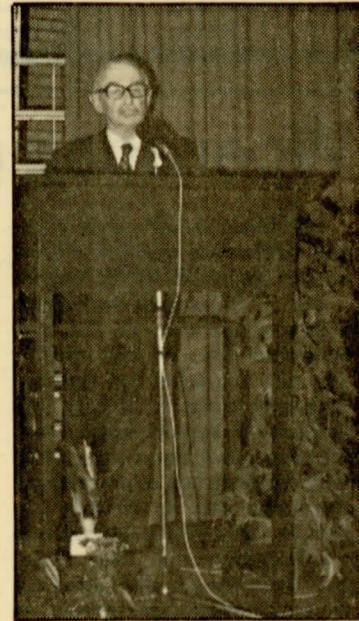
...oetgoan te spreken, veurdraagen oet aigen waark: ieder moal aans...

mien verhaal woar gebeurd was. En de drijling, dij zok stok veur stok fiks deur de wereld sloagen hebben, kin t vandoag de dag nog noavertellen ook, as dat mout. Ze hebben heur toustemmen geven, dat ik dat in mien Hörntje al n luk beetje veur heur doan heb.