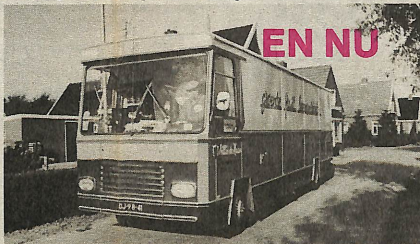
Nu: een rijdende winkel op de verharde weg.