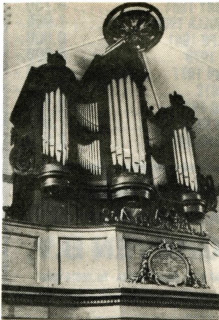
Het orgel in Finsterwolde