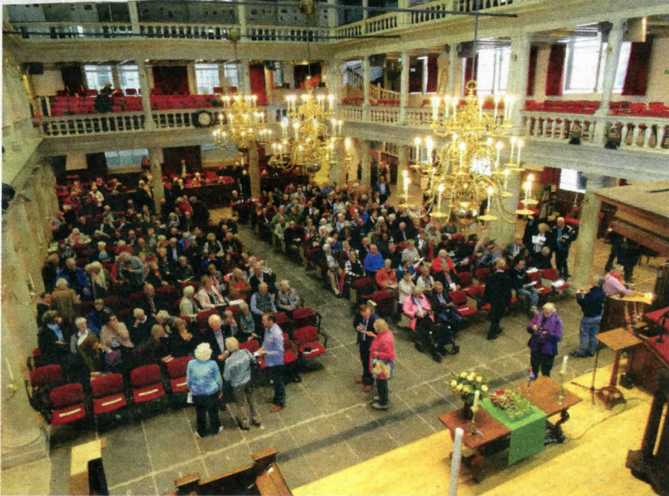
'wát n stuk volk'....

ons wakker ruip ons dizze zundagmörn al om vijf uur; om haalf zeuven gong bus oet Zuudloaren vot doar manlu van 'Cantemus Deo' mit noar t Groot Loug ofraaizen om Grunneger Dainst van koorzang te veurzain. Ze haren verdold dij haile grode toeringbus vol kregen en zodounde wer raais vanzalm oareg goudkoper. Wazzen aal dizze mensken nô echt zo bot roupen?