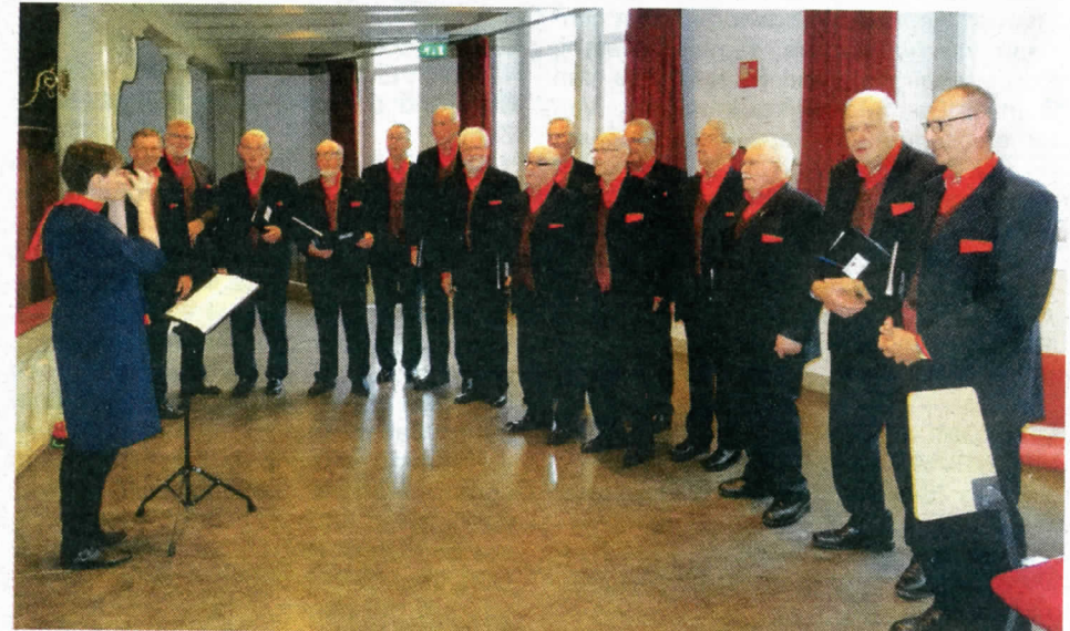
Deo Cantemus aan t ienzingen

loater zegt dat e Petrus en Pauluskerk van Loppersom mooiste kathedraal van pervinzie viendt. "Ie binnen roupen" zo staait ter. Dat streepke onner 'ie', heb ik der onner zet. Zó kwammen wie ja weer tou kerk oet. Wie kregen vannijs of veur zoveulstemoal ien de goaten dat wie dat gemain hemmen mit Oabram en mit Zacheüs. Oabram mos zien hoes, zien laand achter zok loaten, Hai snee zien woddels deur. Wol e meer diverdoatsie hemmen? Ducht hom dat e t beder kriegen kon op n aander stee? Hou din ook, hai haar t gevuil dat Laimeneer hom ruip en dou gong e. Zacheüs wer ook roupen, hai zat allerdeegs hoog ien boom, gainain haar hom ien de kiekerd. Mor dij aigenste noar wel of e op zuik was, wol oetrekend bie hóm ien hoes kommen! Zacheüs haar t votdoalek deur: hai zol zien levent aans ienrichten, hai gef t haalfschaid van zien hebben en hollen aan aarme lu en gef t aine dij hai òfzet het dubbeld en dwaars weerom. En wat zegt Jezus – dij op slag deur röddelpers onneroethoald wordt -: "Nou is ter veur dizze hoesholden redden kommen." Zo'n oetspraak veur Zacheüs komt ja op t zulfde deel as wat loater schriever van Romaainenbraif over