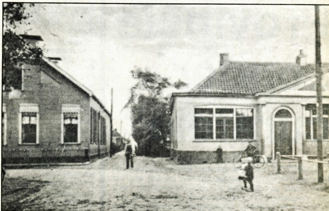
...n plaatje van d olle schoule waarkt nog altied op mien gevuil...

Meester haar t ook vot de veur straf mog ik nait mit schoulraaize noar Potterw en mos ik veur dij aigenste d viefdien dikke optel- en otreksommen moaken. M goud de pest in zat ik in veu koamer, tot ik dochde: „Meester kikt dizze sommen tonait noa”. t Was dou mor ebiegoan om der zo mor v getallen onder te zette. Kloar! Dij dag heb ik n bou dat ik stiekem mitnomen ha in ainmoal oetlezen. n Bou